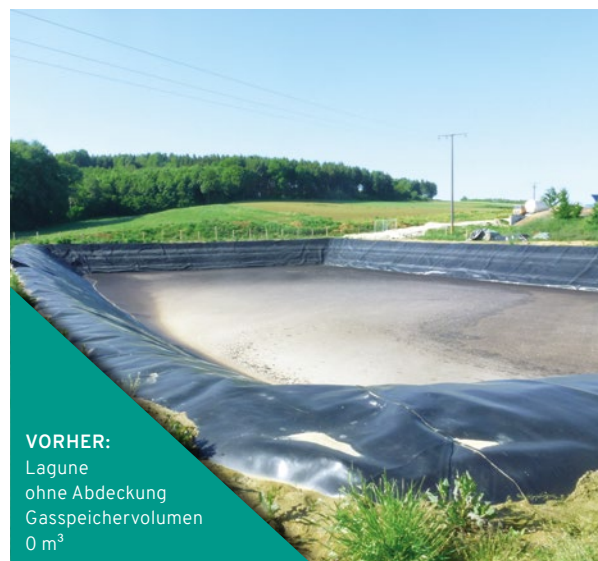
VORHER: Lagune ohne Abdeckung Gasspeichervolumen 0 m 3