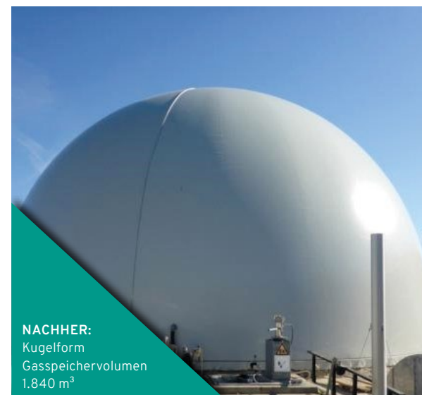
NACHHER: Kugelform Gasspeichervolumen 1.840 m 3