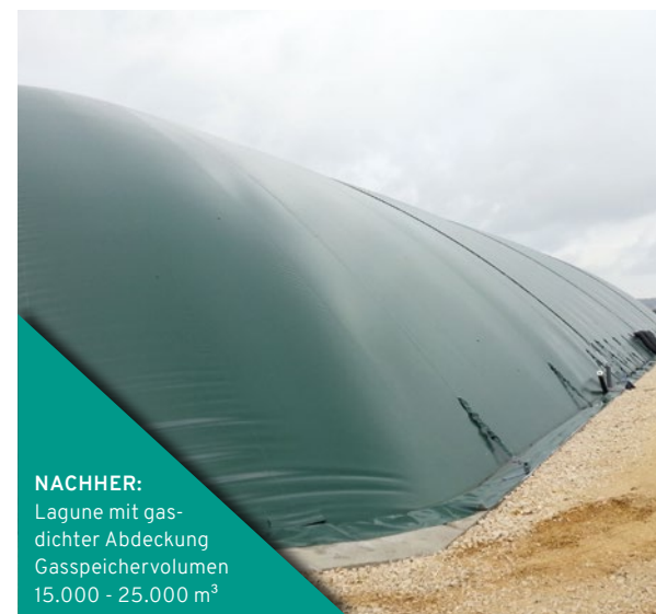
NACHHER: Lagune mit gas- dichter Abdeckung Gasspeichervolumen 15.000 - 25.000 m 3