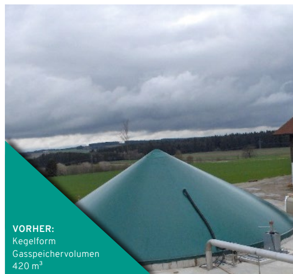
VORHER: Kegelform Gasspeichervolumen 420 m 3