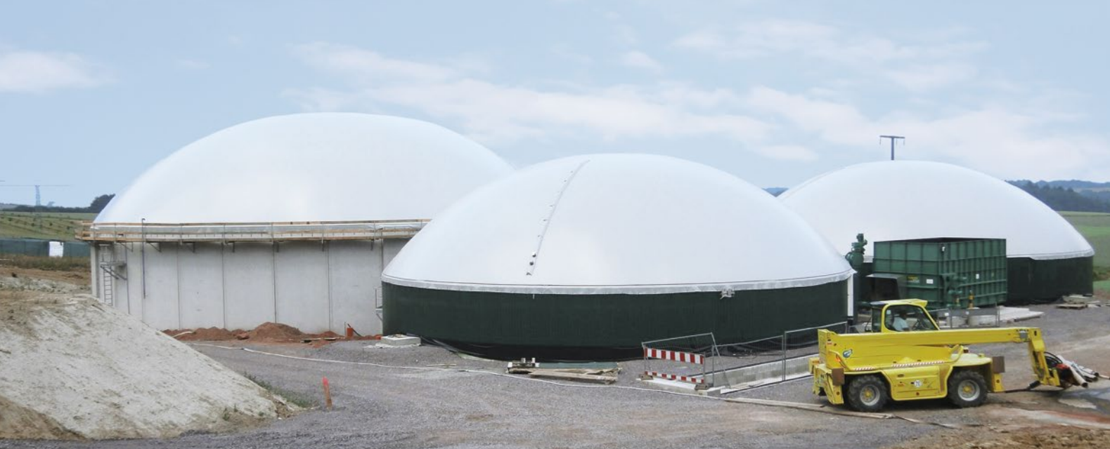
GASOMETRO A DOPPIA MEMBRANA

Il gasometro a doppia membrana rappresenta l'attuale sviluppo nello stoccaggio del biogas.