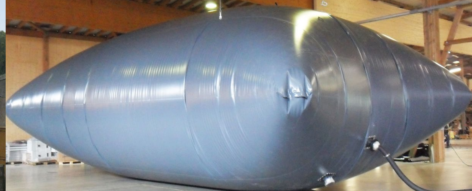
SISTEMI DI STOCCAGGIO GAS IN TELO PVC

Realizziamo coperture anti emissioni in base alle vostre esigenze, anche per vasche grandi. Le aperture di ispezione e manutenzione anche in dimensioni maggiori.