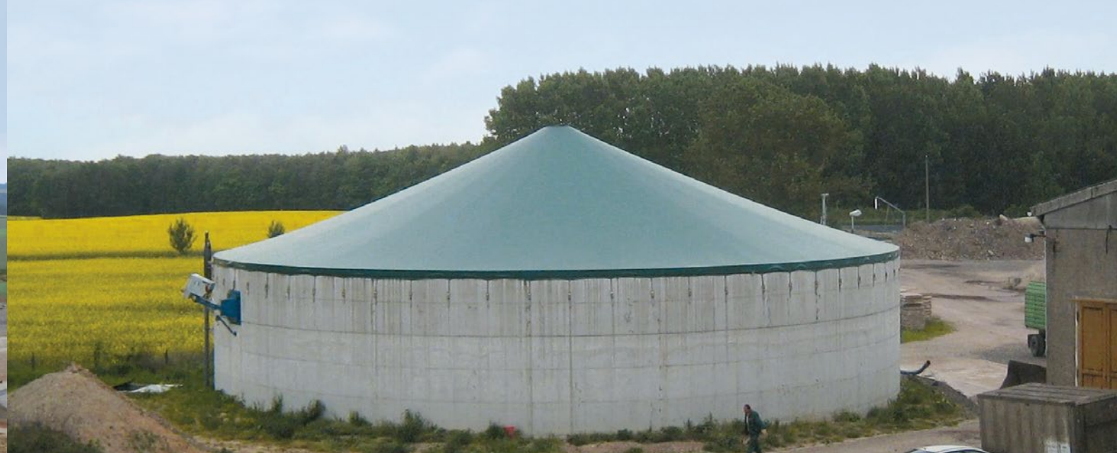
COPERTURE TESE MONO MEMBRANA

Le coperture a strato singolo senza gasometro sono ormai indispensabili nell'ambito zootecnico per il rispetto delle norme anti emissioni.